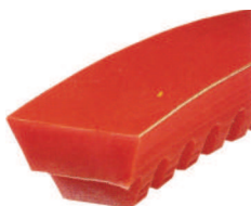
Fogazott műanyag ékszíjak