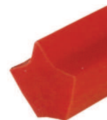
Form-1 műanyag ékszíjak